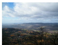
Vrch Sedlo(727 m n m), třetí nejvyšší vrch Českého středohoří a nejvyšší vrch Verneřického středohoří

www.nature.cz , www.ceskestredohori.ochranaprirody.cz .